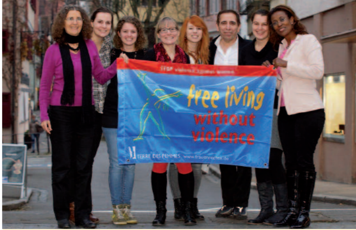
Das Team des Filmfests FrauenWelten gemeinsam mit dem iranischen Regisseur Mohsen Makhmalbaf und der äthiopischen Frauenrechtsanwältin Meaza Ashenafi.